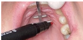
Figure2 : Marquez la position des vis