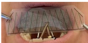
Figure 4 : Contrôle de l'inclinaison à partir de la position de la vis. Contrôle de l'angle de la vis : environ 15 degrés