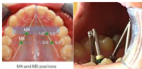
Figure 5 : Position M4 15 degrés mésial - Position M5 15 degrés distal inclinaison de la vis.