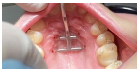
Figure 3 : Vérification de la symétrie de la position de la vis. Vérification de la symétrie de la position de la vis